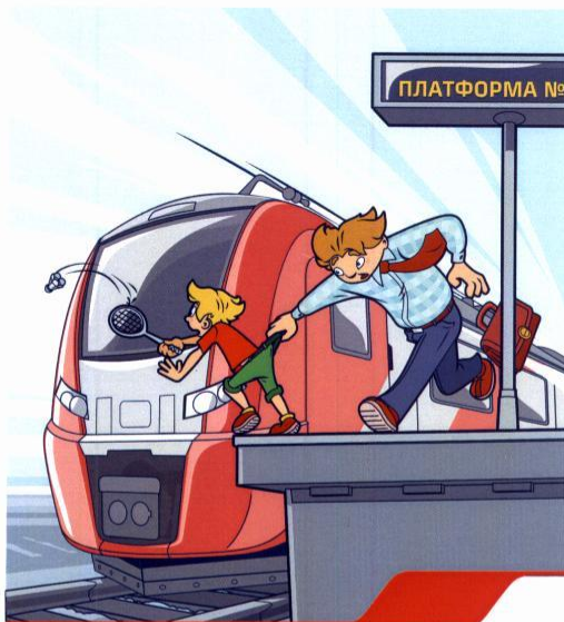
Железная дорога – не место для игр!